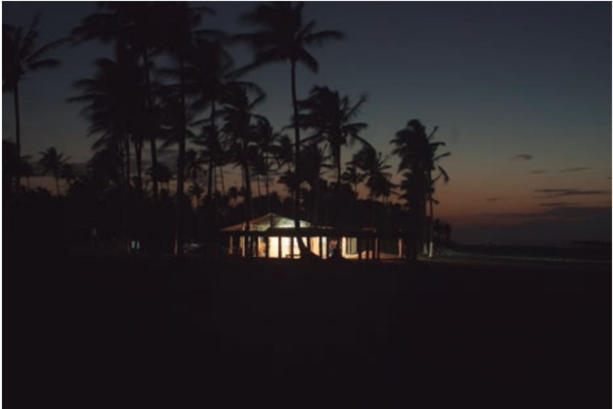
Guadalupanos (página anterior) Frontera, Centla, Tabasco. 2011