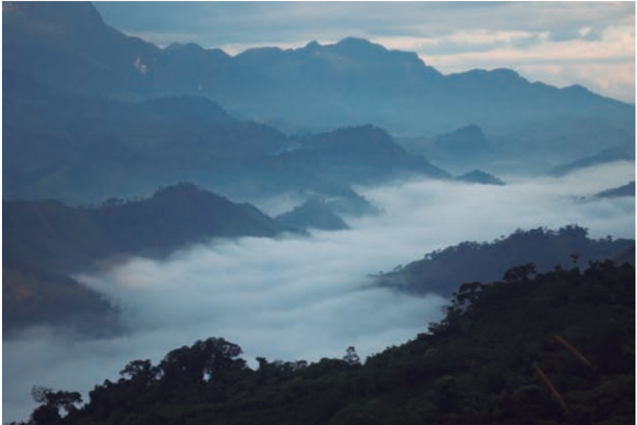
Montañas Amatán, Chiapas. 2010