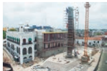
Plaza Bicentenario Villahermosa, Tabasco. 2010