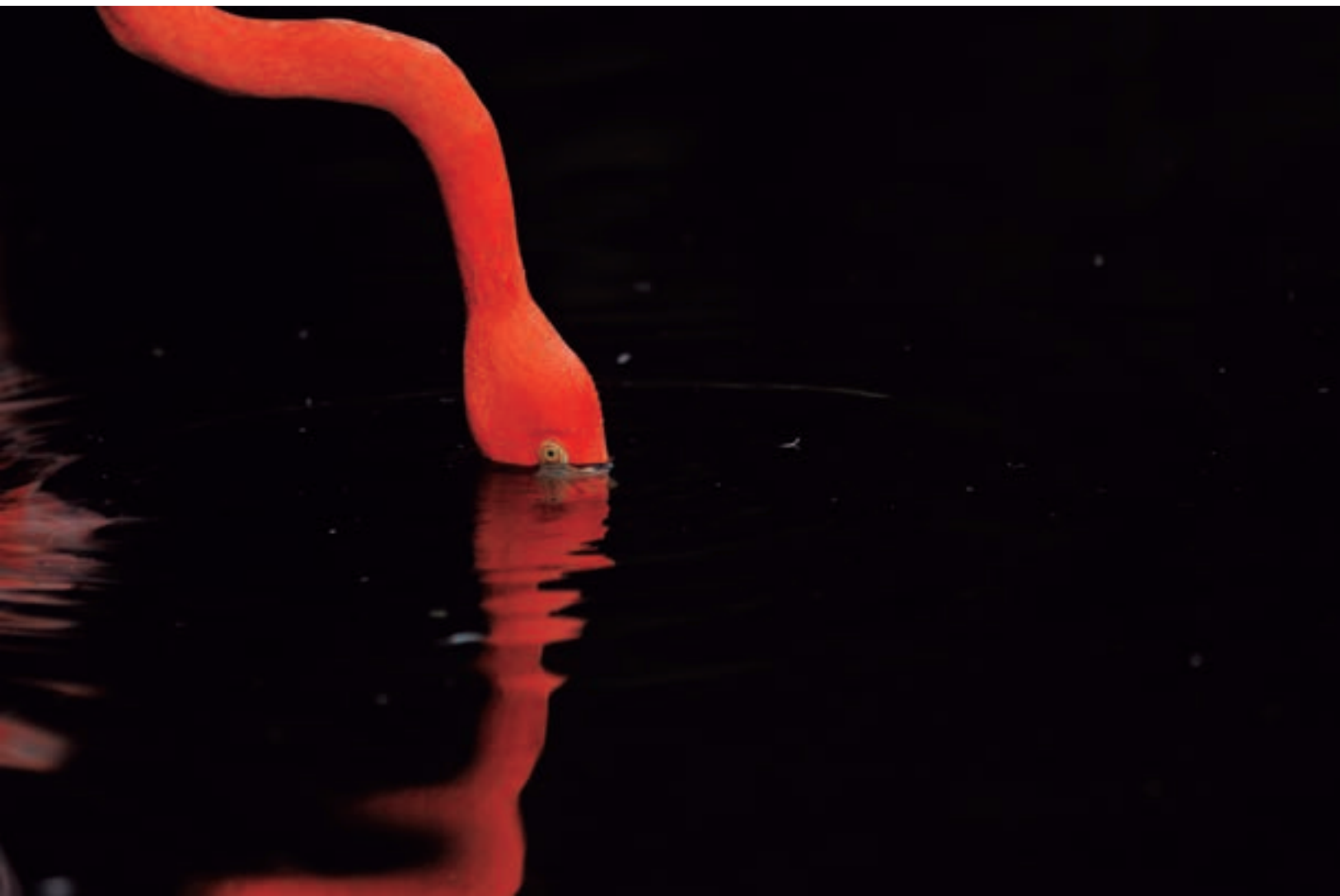
Espejo Ecoparque Aluxes, Palenque, Chiapas. 2012