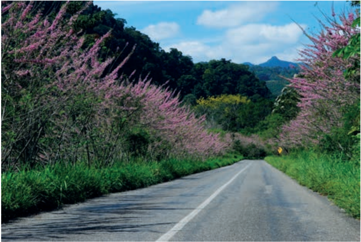
El camino Puyacatengo, Teapa, Tabasco. 2010