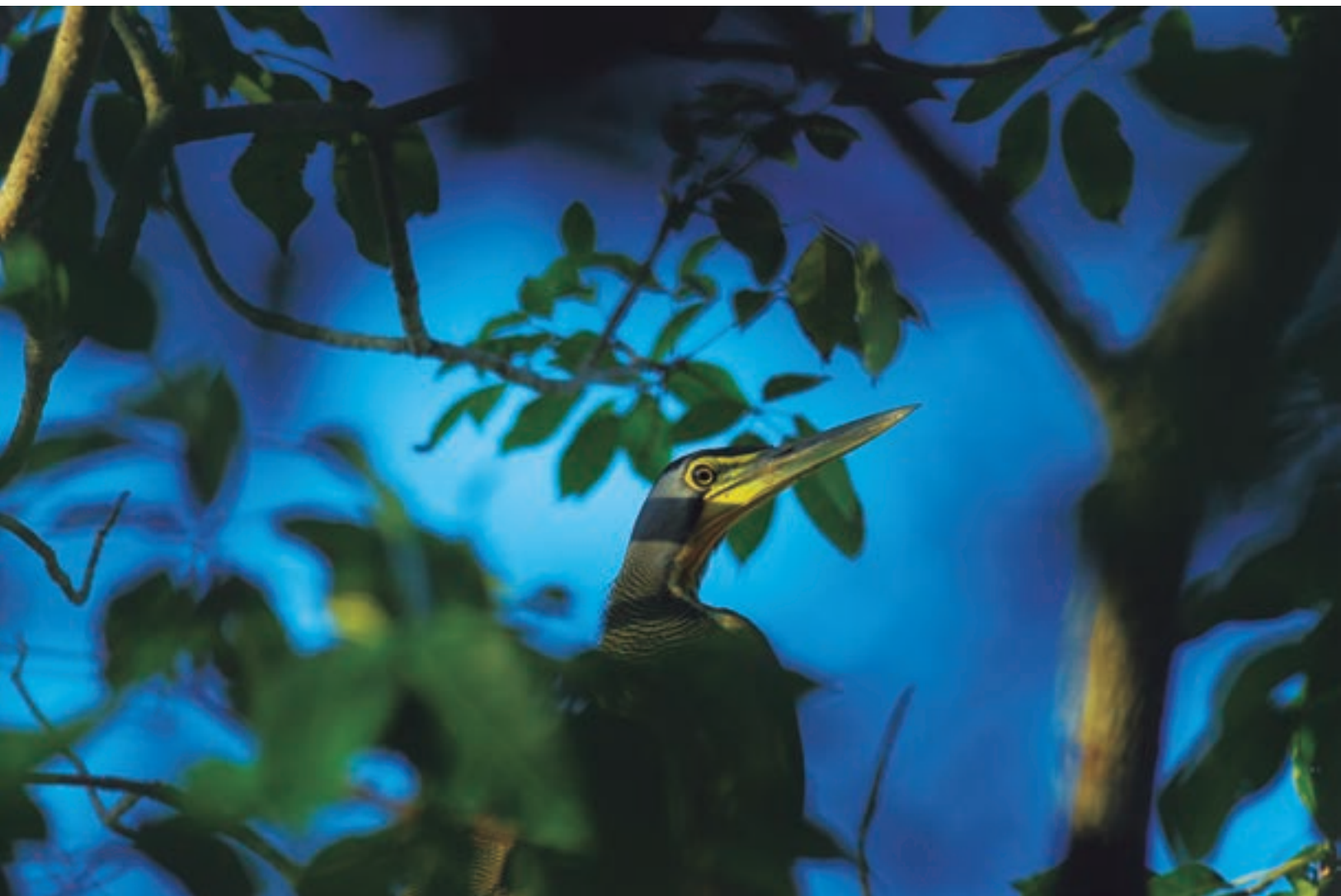
Garza tigre Pantanos de Centla, Tabasco. 2009