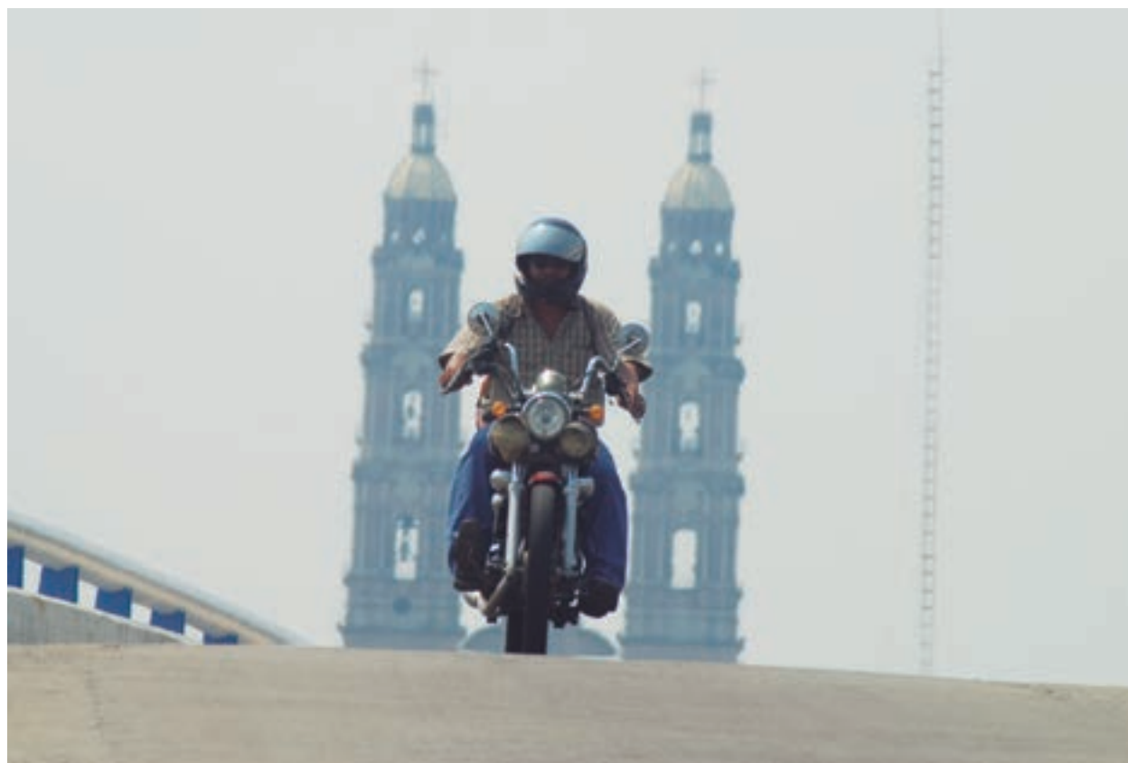
Sobrerruedas Villahermosa, Tabasco. 2011