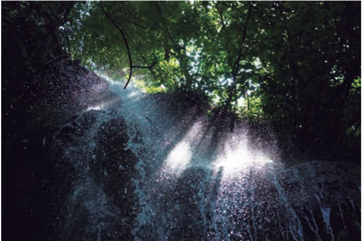
Cascada Oxolotán, Tacotalpa, Tabasco. 2011