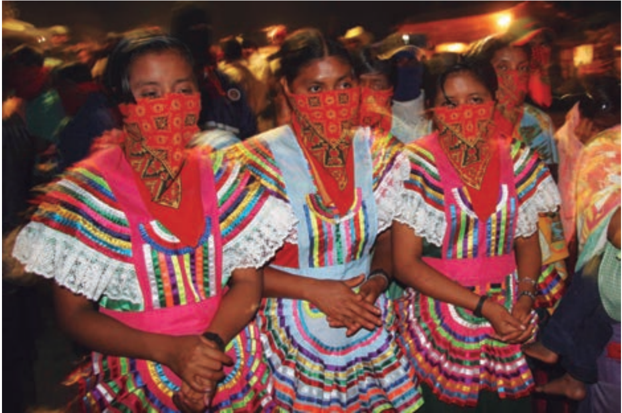
Mujeres Zapatistas La Garucha, Chiapas. 2005