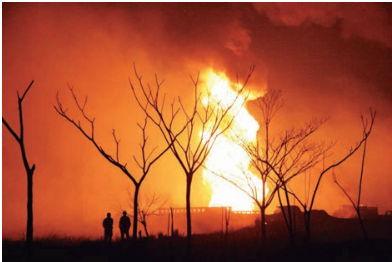
Explosión de ducto Huimango, Cunduacán, Tabasco. 2005