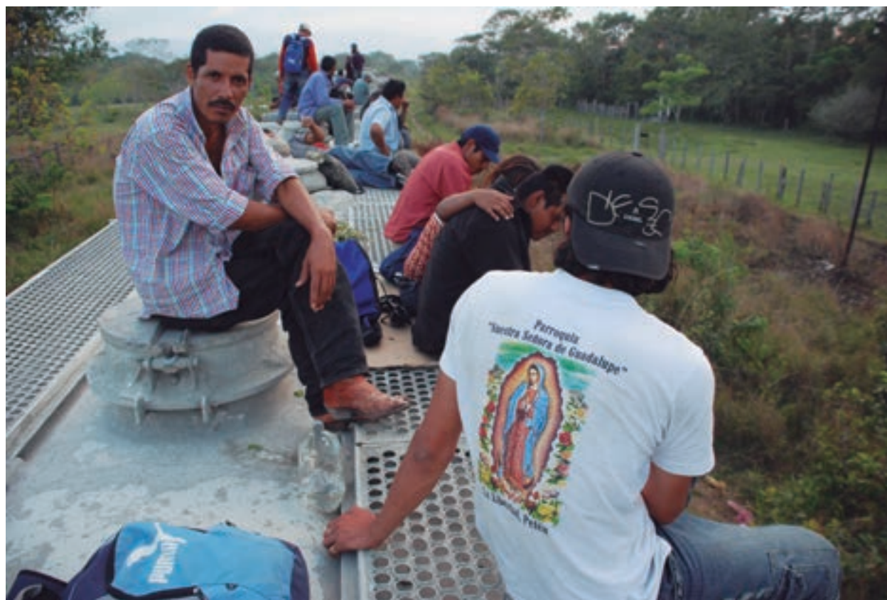
Migrantes Palenque, Chiapas. 2008