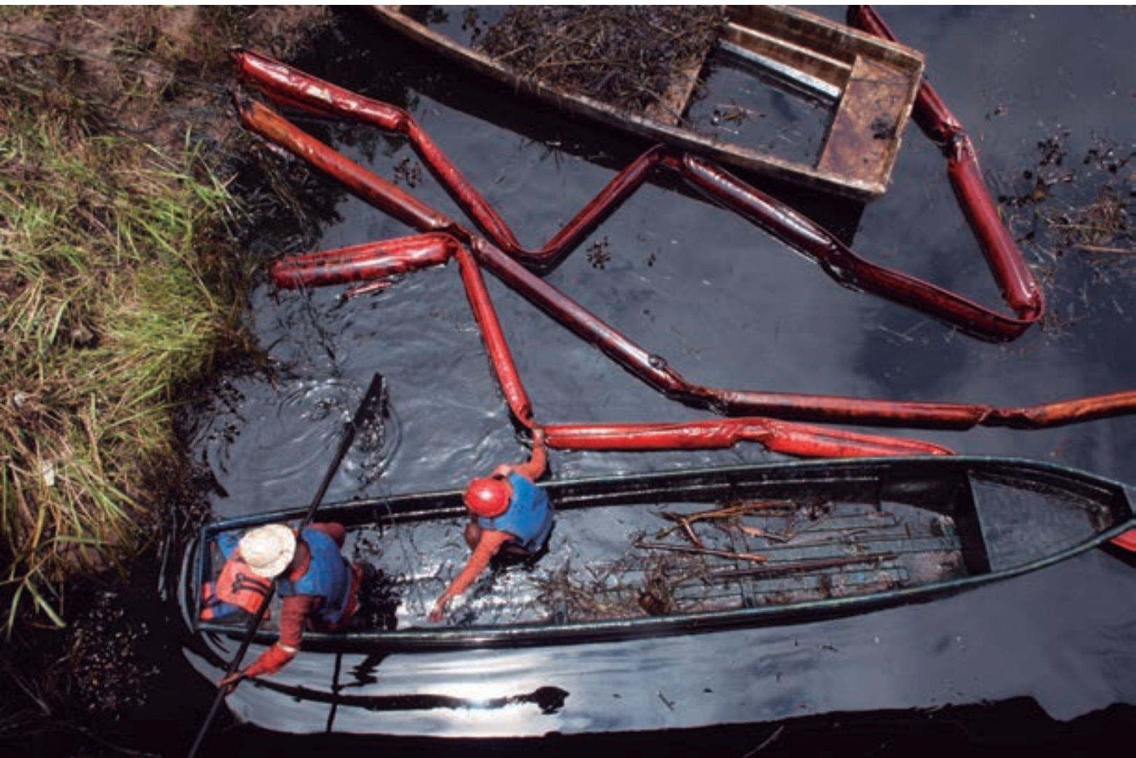
Derrame de hidrocarburo Cumuapa, Cunduacán, Tabasco. 2012