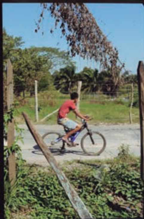
Desalojo de Pemex Loma de Caballo, Centro, Tabasco. 2012