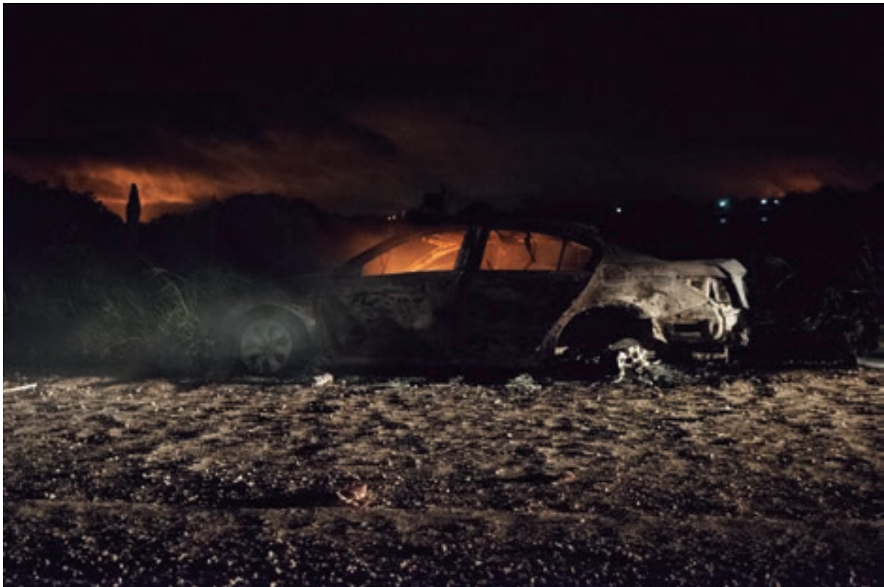
Calcinado Centro, Tabasco. 2013