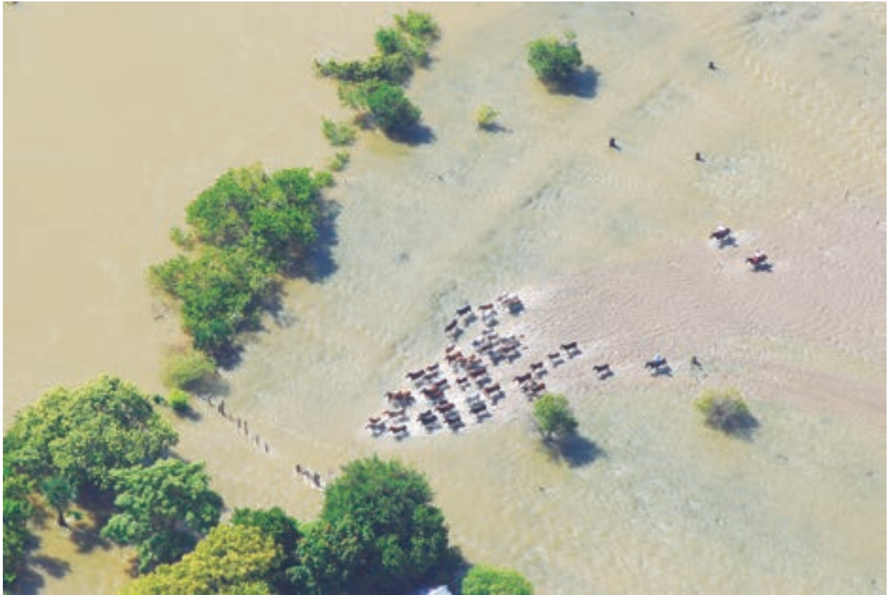
Inundación Balancán, Tabasco. 2008