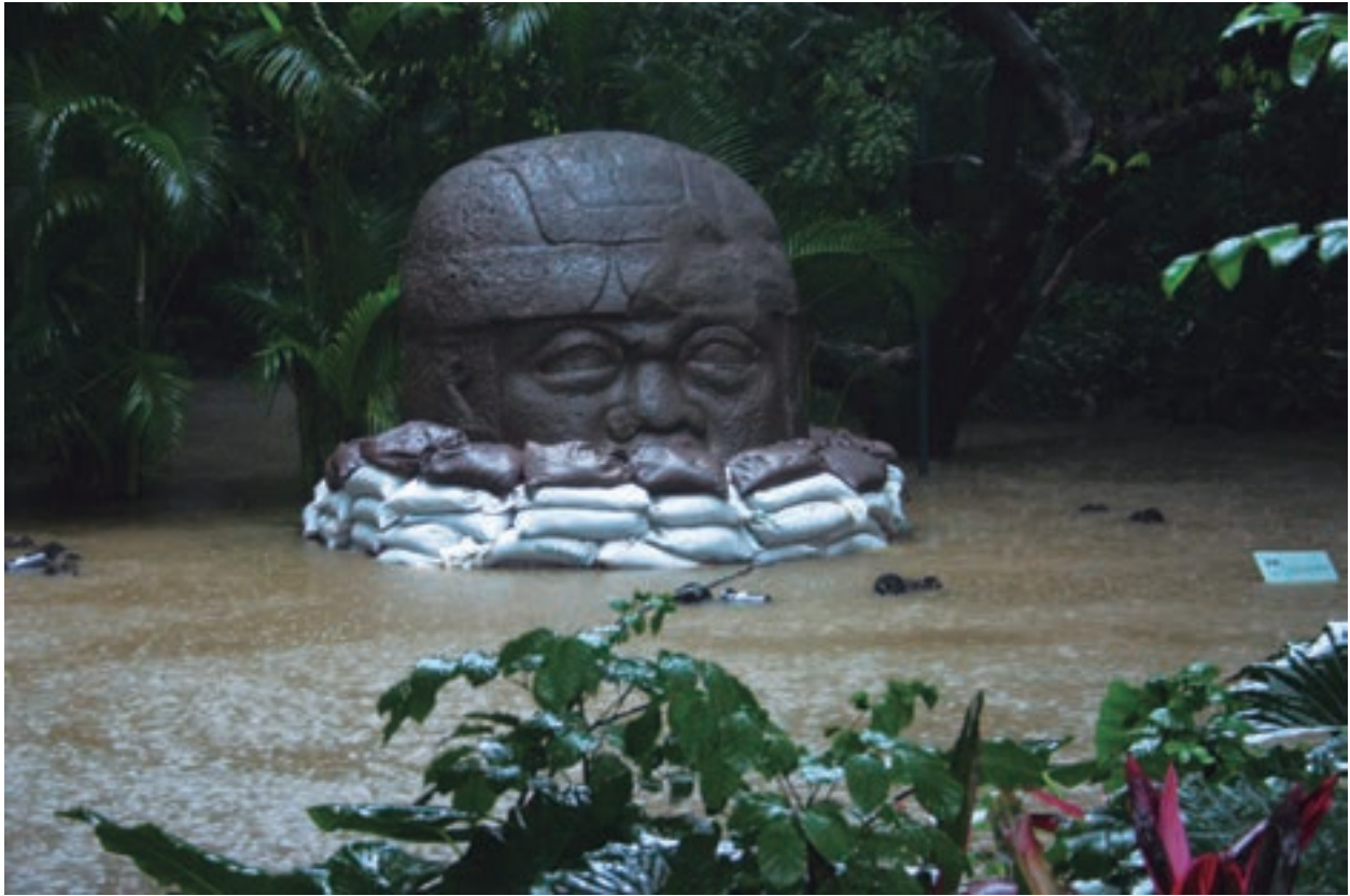
Cabeza Olmeca Parque Museo de La Venta, Villahermosa, Tabasco. 2007