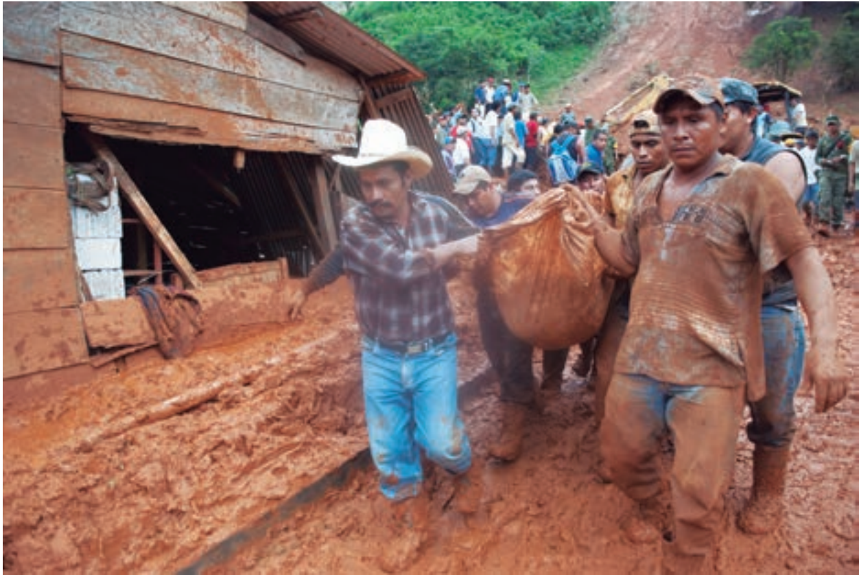
Los restos del derrumbe Reforma y Planada, Amatán, Chiapas. 2010