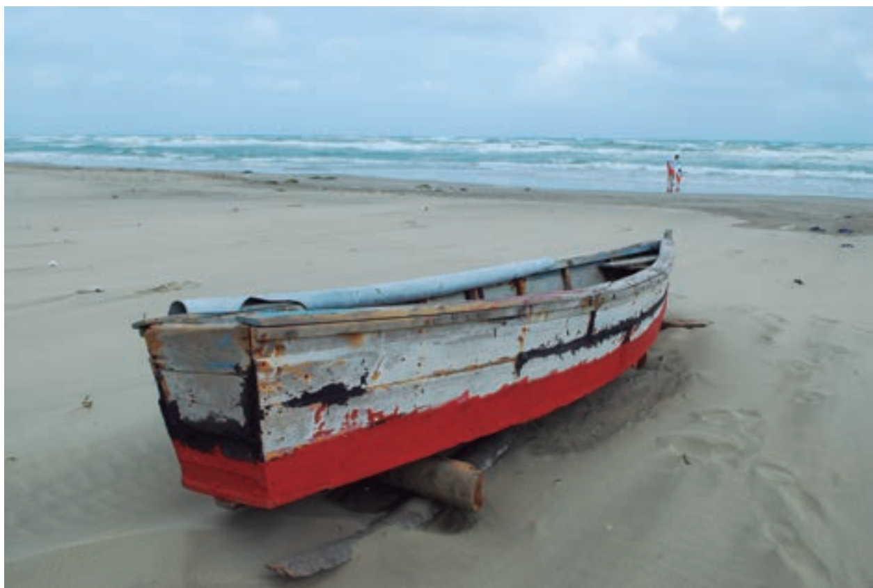
La barca Paraíso, Tabasco. 2009