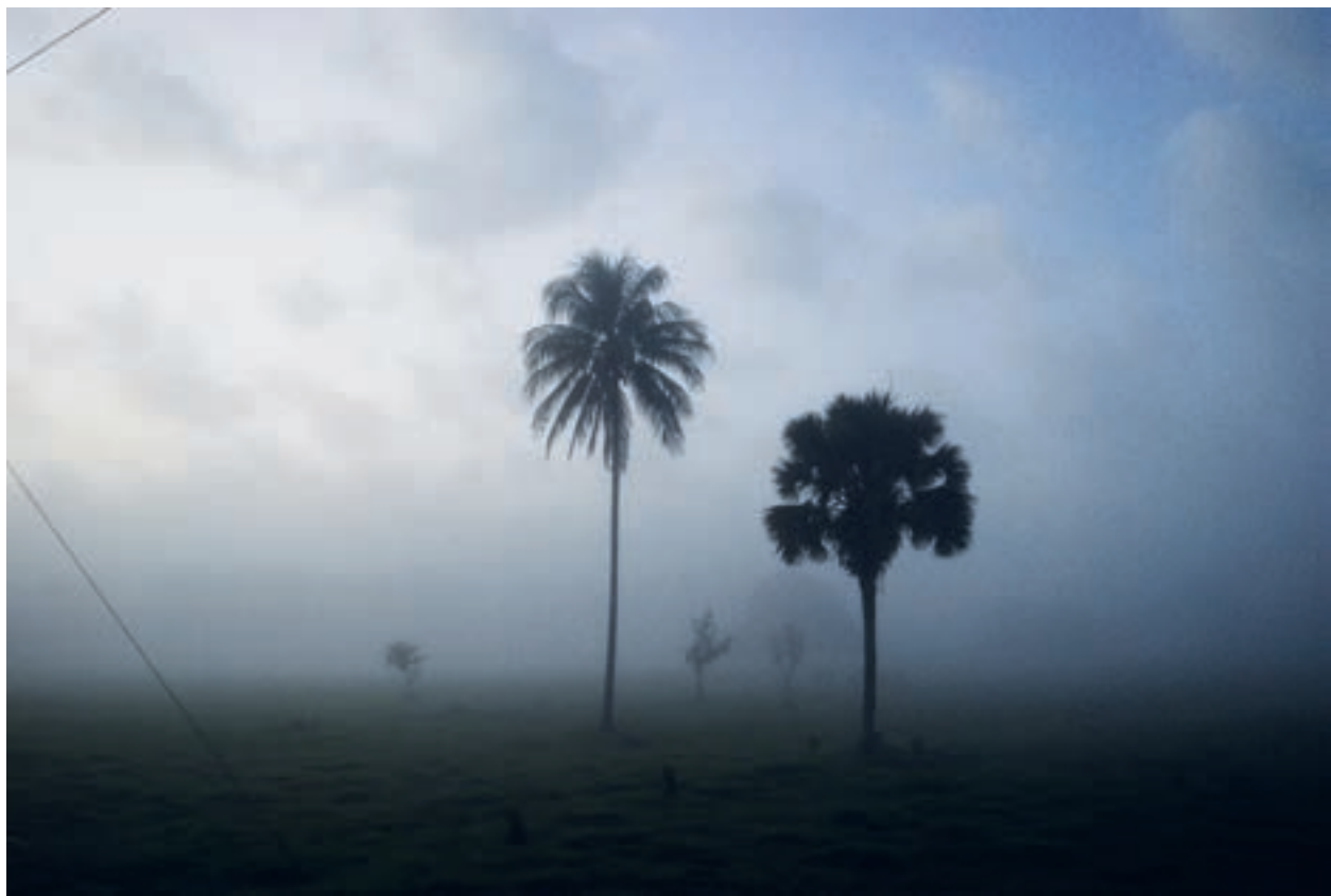
Amanecer Boquerón, Centro, Tabasco. 2009