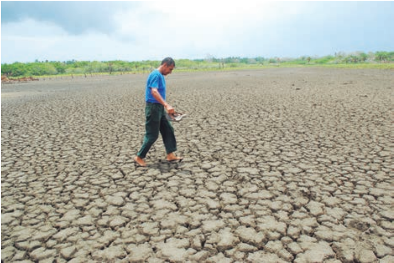
Sed Paraíso, Tabasco. 2011