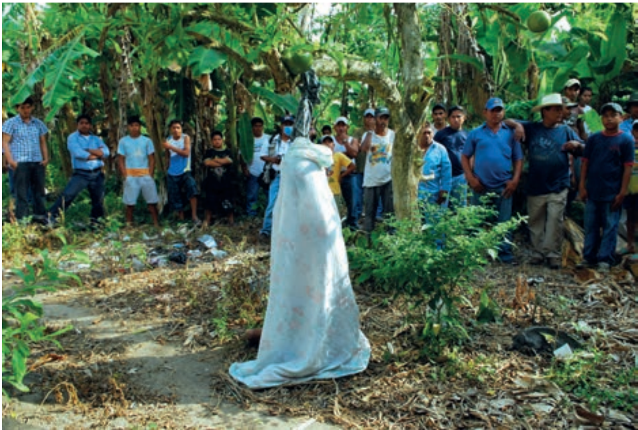
Ahorcado Plátano y Cacao, Centro, Tabasco. 2009